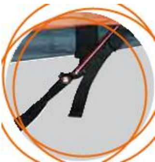
چسب پارچه‌ای برای اتصال پوش بیرونی به داخلی