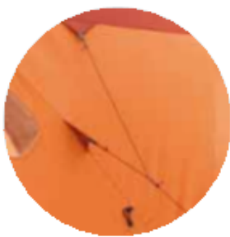
سیستم طناب متصل شونده به چند نقطه