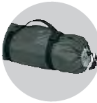
ساک لوازم و تسمه‌های جمع کننده