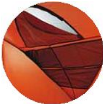
جیب‌های داخلی و حلقه‌های نگهدارنده ابزار