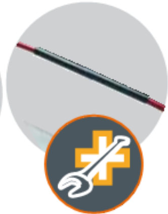
کیت تعمیر: برای تیرک‌ها، حلقه‌های آویز و پوش داخلی و بیرونی