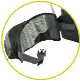
تسمه کمربند با باله‌های جدا شونده