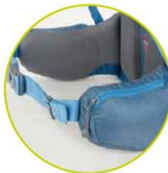
جیب روی تسمه کمری