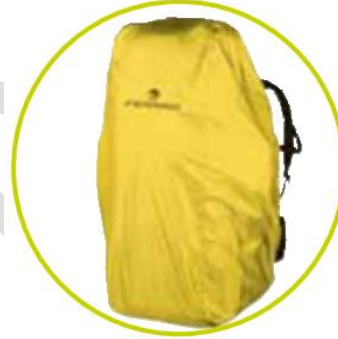
دارای کاور کوله