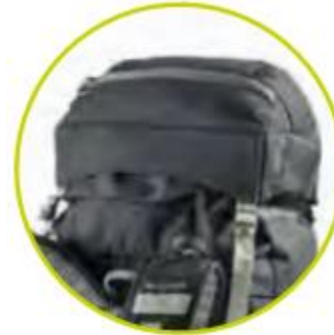
کلاه اضافه کننده حجم