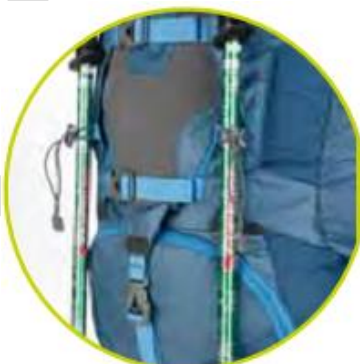
تسمه برای نگهداری تبر یخ یا باطوم