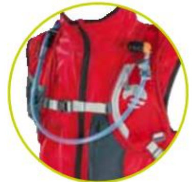
دارای جای کمر بک Hydration Control System