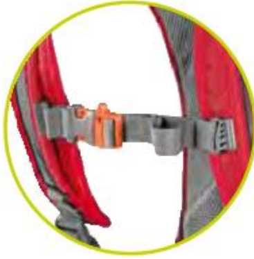
تسمه روی قفسه سینه با سوت اورژانسی