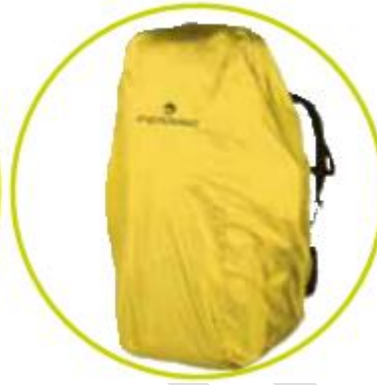
کاور کوله پشتی ضد آب