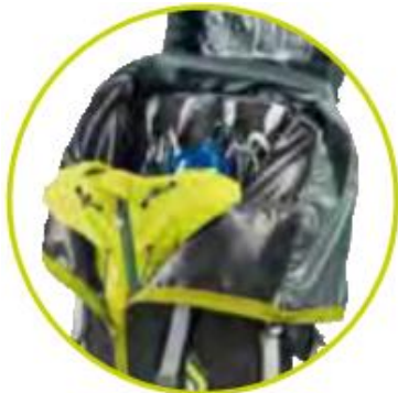
دسترسی از جلو به داخل کوله