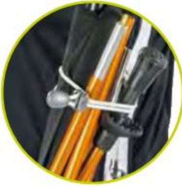
تسمه‌های کشی برای باطوم‌ها