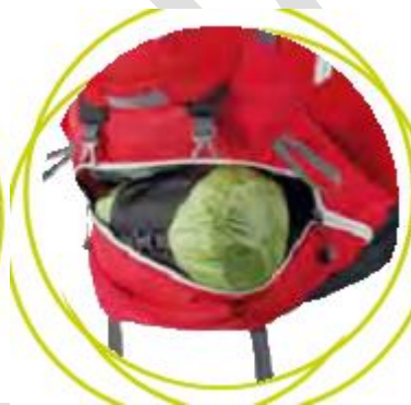
دسترسی از زیپ قسمت پایین