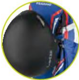
نگهدارنده کلاه کاسکت