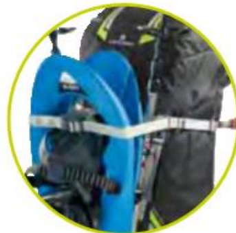
تسمه‌های اضافی برای حمل اسنو‌برد/کفش اسکی