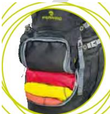
دسترسی از جلو به داخل کوله پشتی (Overland-Flash)