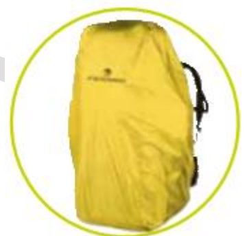
کاور کوله ضد آب