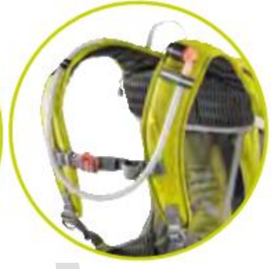
دارای جای کمل‌بک